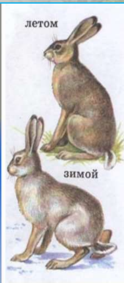
Заяц - русак