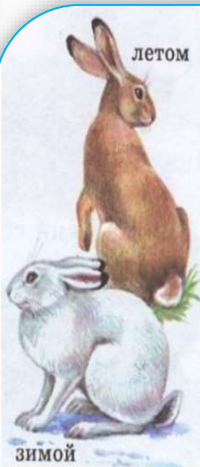
Заяц - беляк